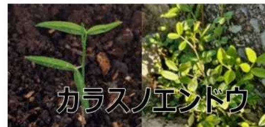
カラスノエンドウ