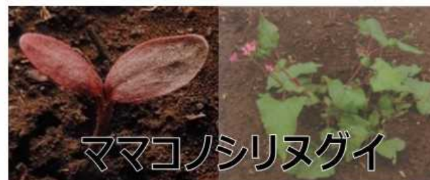
ママコノシリヌグイ