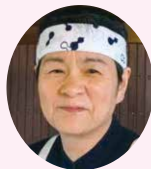
NHK 「きん☆すた」でおなじみの