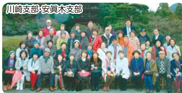
川崎支部・安真木支部