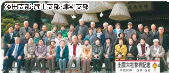
添田支部・彦山支部・津野支部