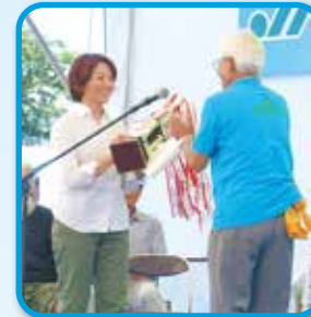
平成30年度 第21回 JAたがわ花卉部会 夏季切花品評会 入賞一覧表