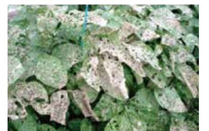
大豆におけるハスモンヨトウの被害

・平成30年産良質米稲作および大豆栽培ごよみは、自宅の見やすい場所に貼り、作業ごとに確認しましょう。 ・安全・安心な大豆生産のために、使用した農薬・肥料名、使用量は作業の都度、栽培管理表に記入をお願いします。