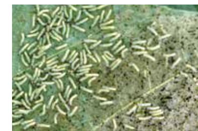
葉裏に群がるハスモンヨトウの若齢幼虫