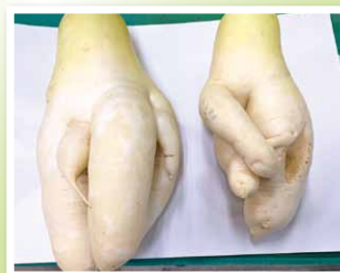
生産者 秋野 隆 様 住所・・・田川郡福智町弁城