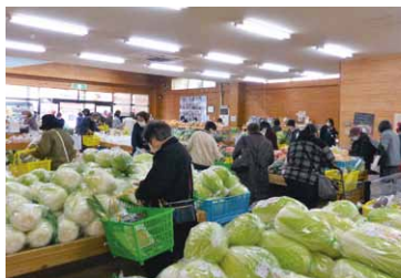
▲直売所店舗内は大盛況