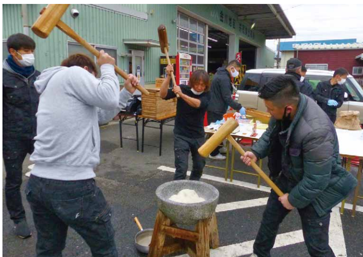
▲青壮年部が餅つき奮闘!!

次回の大売出しは4月に予定しております。新鮮野菜などお買い求めの際には農産物直売所「来てみんなね・かながわ」へお越しください。皆様のご来店をスタッフ一同心よりお待ちしております。