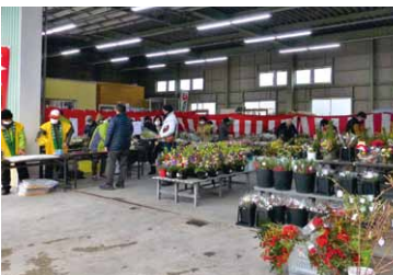
▲綺麗な正月用飾り花