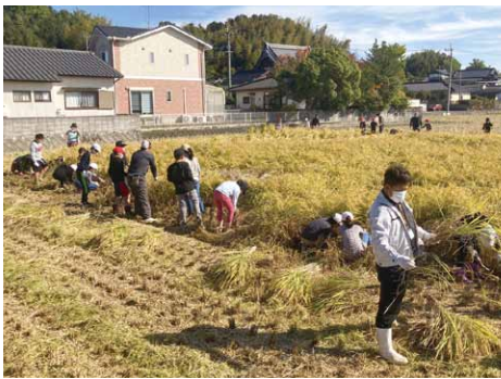
10月31日(月)・・・金川小学校5年生