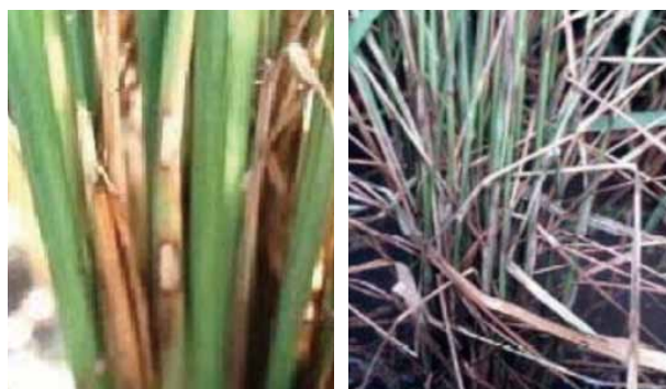
左:紋枯病の病斑(停滞型) 右:進行型発病株

そのため、来年度の良質米稲作ごよみでは、紋枯病対応の箱施薬剤(ブイゲットハコレンジャーL粒剤)を採用する予定です。基幹防除を徹底するとともに、施肥基準を参考して頂き肥料を入れすぎないようにしましょう。