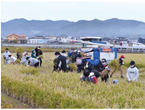
10月27日(木)・・・後藤寺小学校5年生

年部や営農指導員のもと、毎年、田植えや稲刈り・芋掘り体験を取り入れています。児童たちは「機械作業で収穫する前の時代はとても苦勞していたことが分かった。手作業で収穫することは、ひと苦勞でした。」と農業の楽しさ