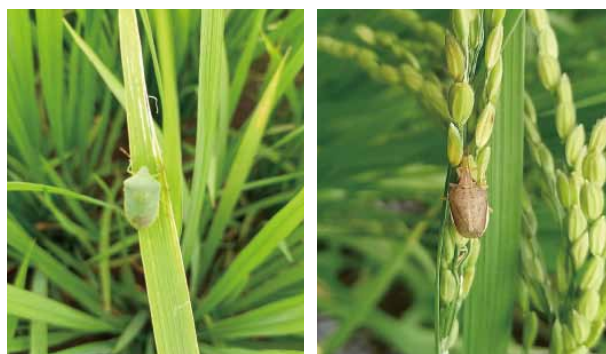
左:ミナミアオカメムシ 右:イネカメムシ