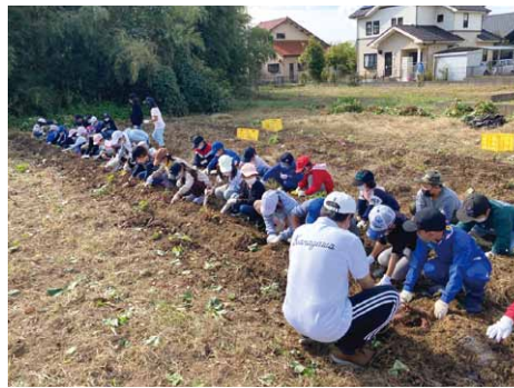
10月28日(金)・・・金川小学校2年生